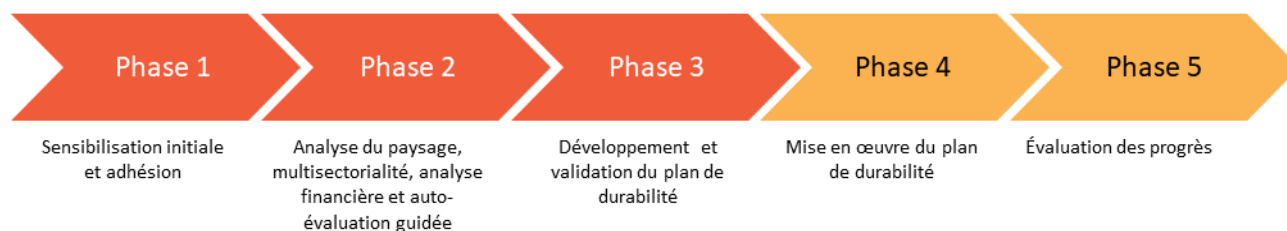
Figure 1 Approche de la durabilité soutenue par l'USAID en Afrique de l'Ouest